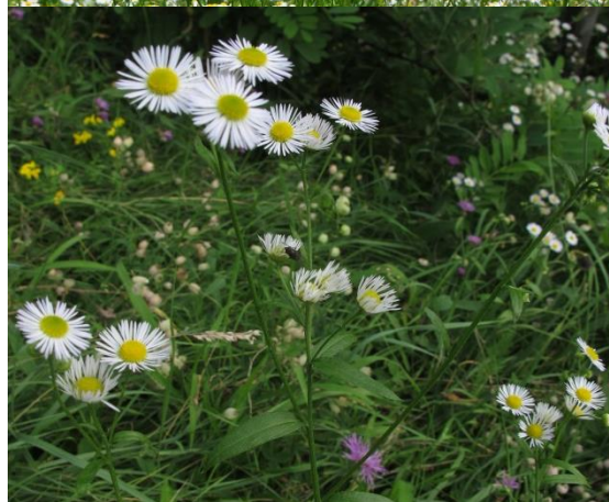
Erigeron annuus