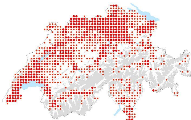
Verbreitungskarte Website Info Flora

Ursprünglich aus Nordamerika stammende, krautige Pflanze, die bereits im 17. Jahrhundert als Zierpflanze nach Europa eingeführt wurde. Obwohl das Einjährige Berufkraut heute nicht mehr vermarktet wird, ist es längst eingebürgert und hat dabei eine Vorliebe für gestörte Standorte. Ursprünglich eine Ruderalpflanze, breitet sich die Art rasant auf Magerwiesen aus und bedroht aktuell die dortige einheimische Flora.