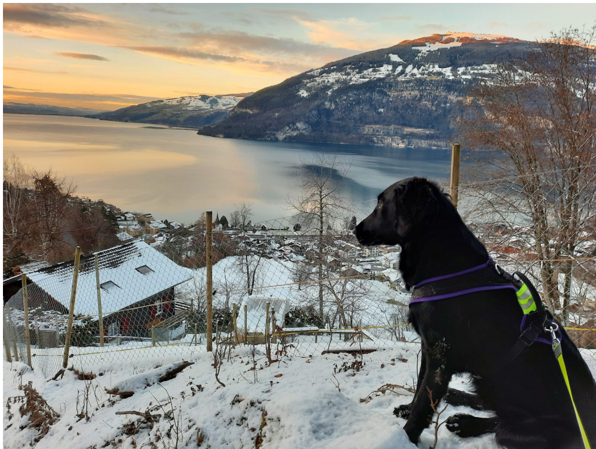
Leissigen, im Januar 2021

Zuallerletzt wünschen wir Ihnen und Ihrem Vierbeiner stets viel Spass und Freude bei Ihren Spaziergängen im schönen Leissigen!